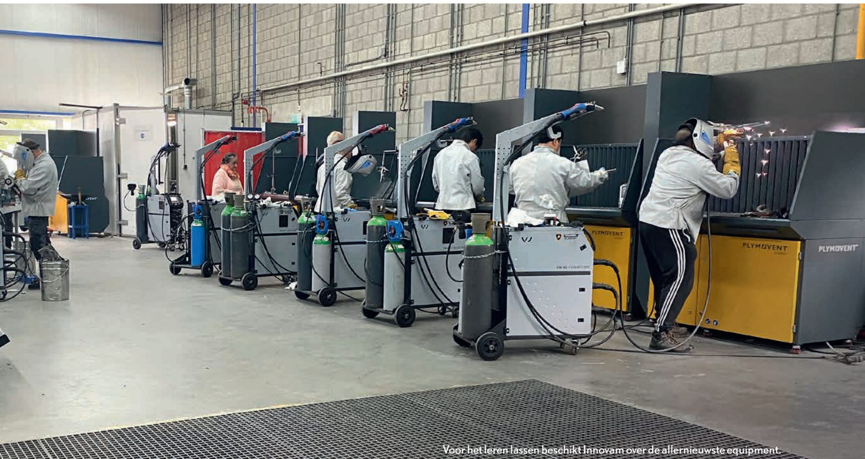
Voor het leren lassen beschikt Innovam over de allernieuwste equipment.