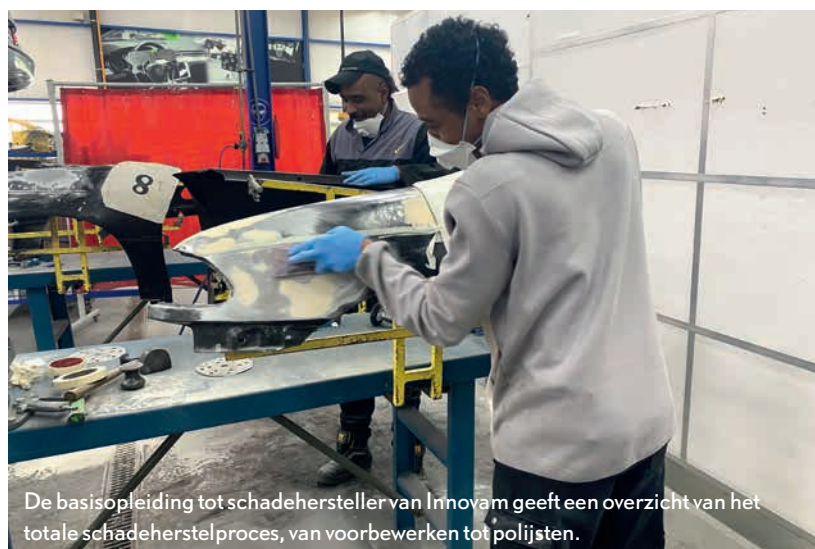
De basisopleiding tot schadehersteller van Innovam geeft een overzicht van het totale schadeherstelproces, van voorbereiden tot polijsten.